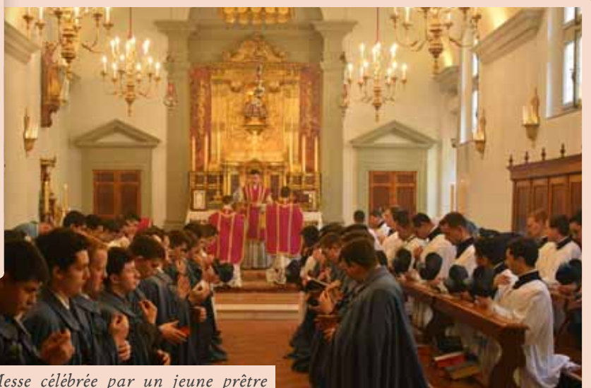
Première Messe célébrée par un jeune prêtre