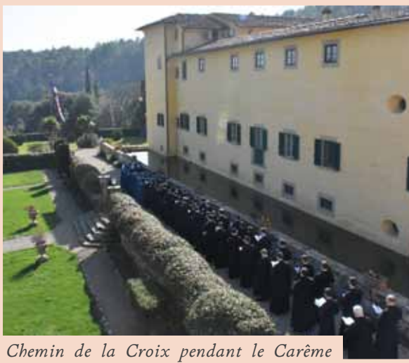
Chemin de la Croix pendant le Carême