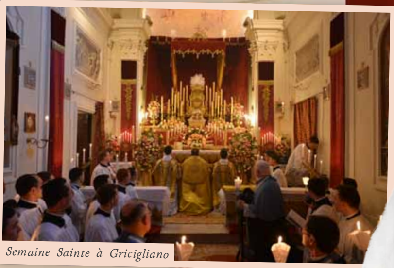
Semaine Sainte à Gricigliano

CETTE LETTRE VOUS parviendra sûrement durant la Semaine Sainte. Hebdomada Major , la Plus Grande Semaine, ainsi la nomme la liturgie qui nous pousse en ces jours à suivre pas à pas notre Seigneur et Sauveur. Nous-mêmes sommes en retraite pour nous engager à sa suite avec une fidélité toujours renouvelée.