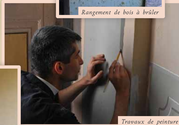
Travaux de peinture