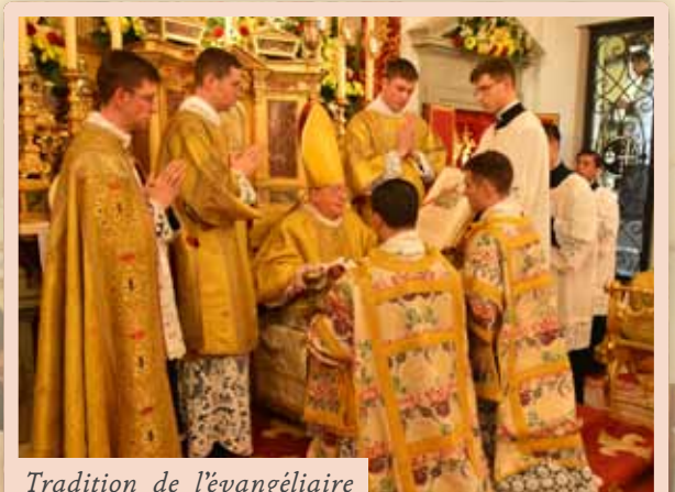
Tradition de l'évangélaire