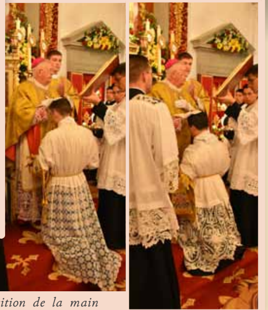
Imposition de la main