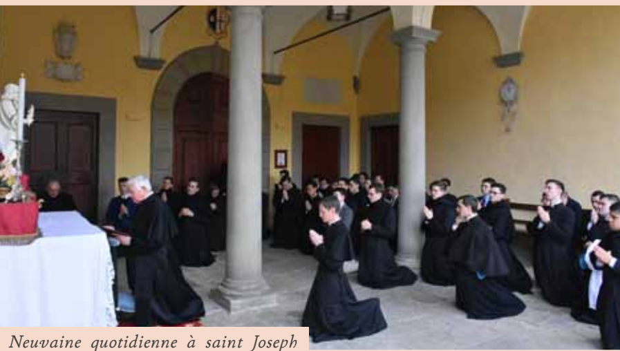
Neuvaine quotidienne à saint Joseph