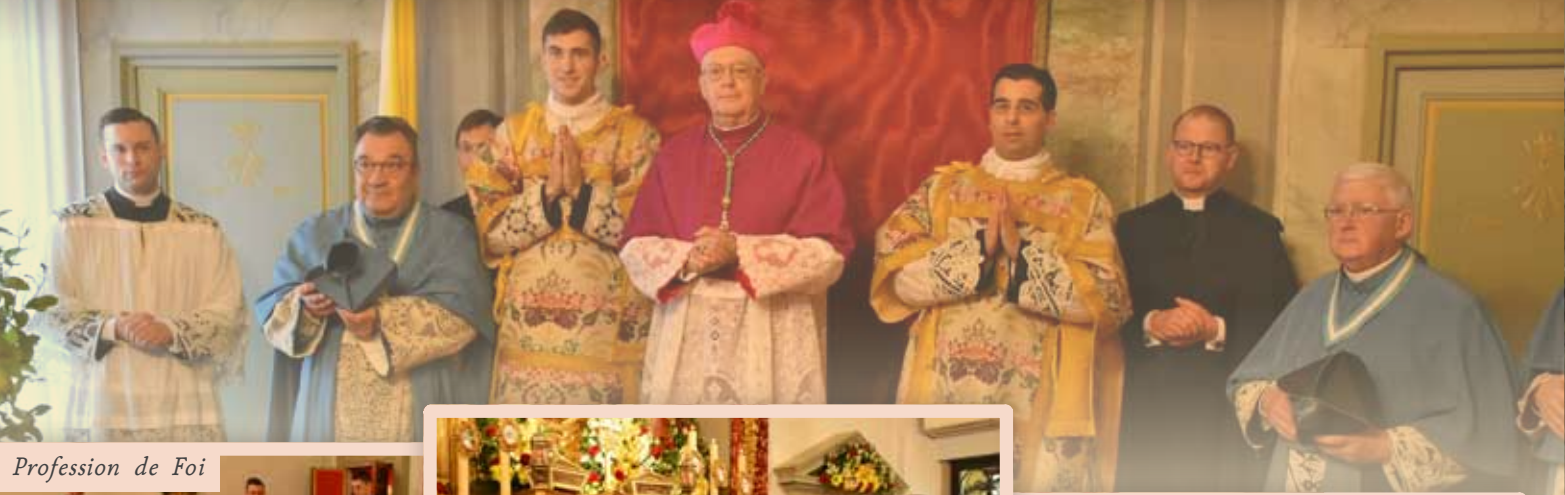
Profession de Foi