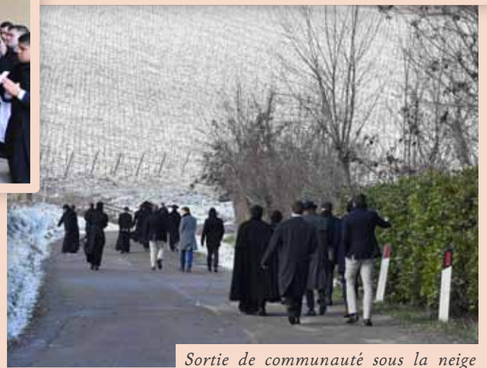
Sortie de communauté sous la neige