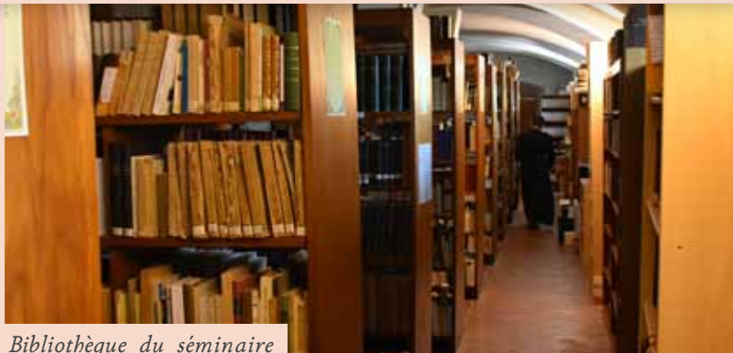
Bibliothèque du séminaire