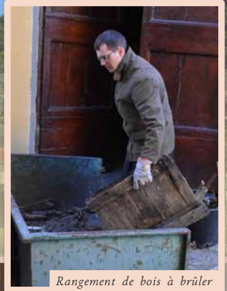
Rangement de bois à brûler

ALORS QUE CETTE ANNÉE est placée tout particulièrement sous le patronage de saint Joseph, nous redoublons notre ardeur au labeur et confions à ce grand saint les intentions qui nous sont livrées. Certes, nous en avons pour nous aussi : son regard paternel sur nos études, sa main habile sur nos travaux, menus ou importants, son exemple de force et discrétion, édifiant nos âmes en formation.