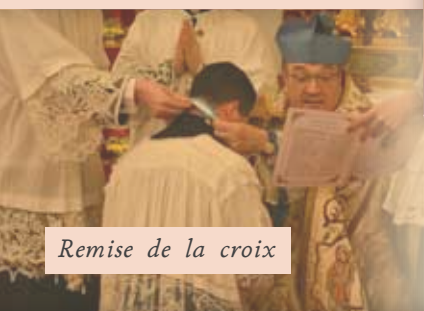
Remise de la croix