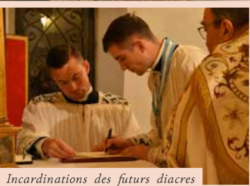
Incardinations des futurs diacres