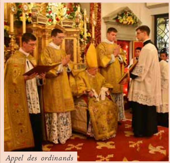
Appel des ordinands