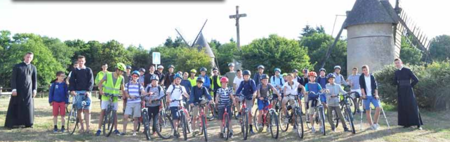
Le Camp vélo Saint-Joseph au sommet du Mont des Alouettes