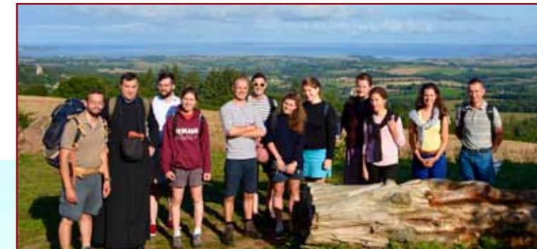
Première édition de la Marche des sept saints en Bretagne