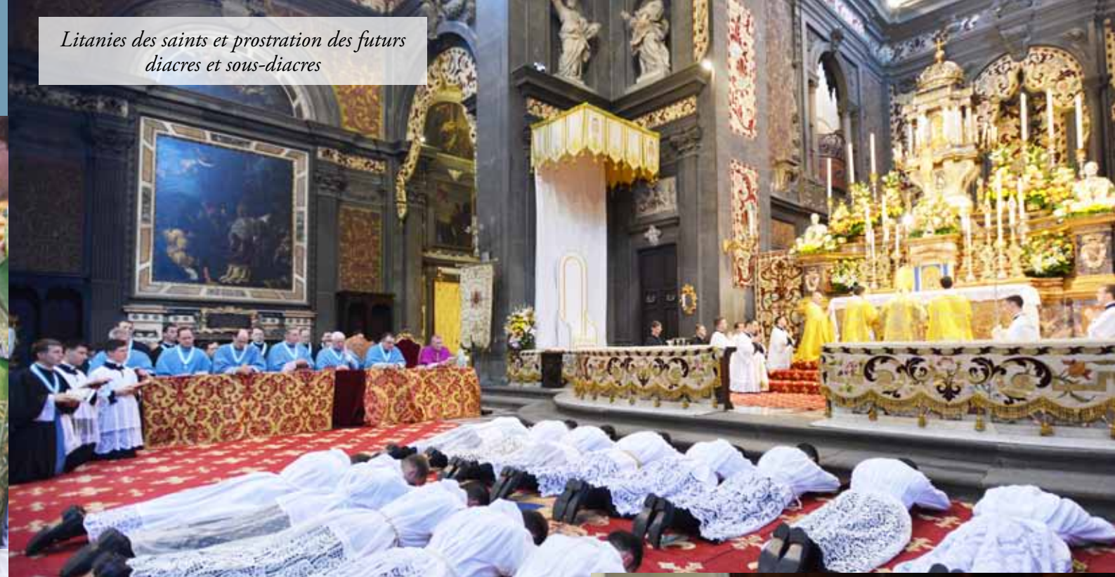
Litanies des saints et prostration des futurs diacres et sous-diacres