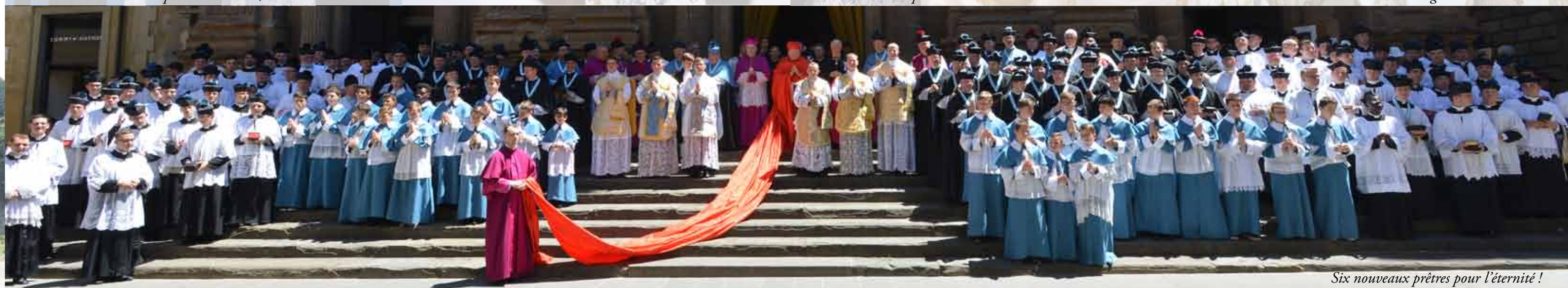
Six nouveaux prêtres pour l'éternité !