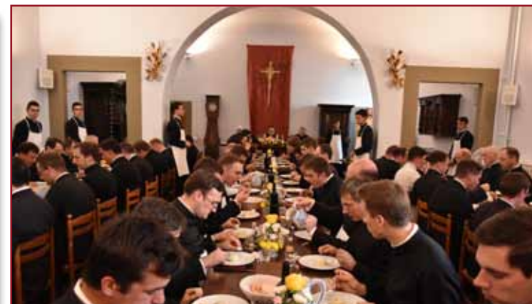
Déjeuner au réfectoire