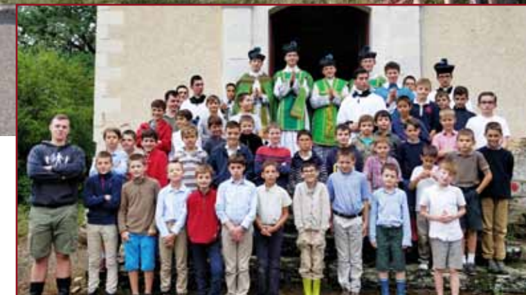
La colonie musicale Sainte-Cécile le soir de son concert

Juillet ! Âgés de huit à trente ans, ils ont bouclé leur sac à dos et quitté leur famille pour passer deux semaines au grand air, sous le regard bienveillant du Bon Dieu.