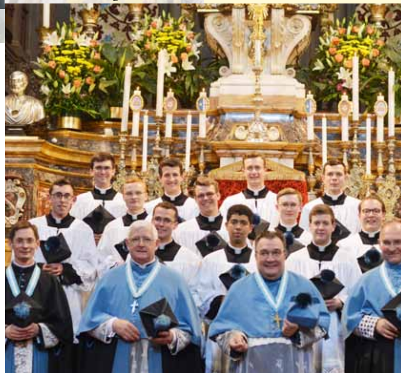
Photo de famille avec les Supérieurs à l'issue des prises de soutane, le lundi