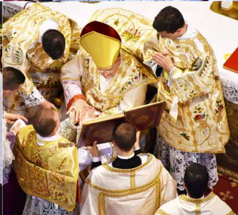
Consécration des mains d'un nouveau prêtre par S.E.R. le Cardinal Burke