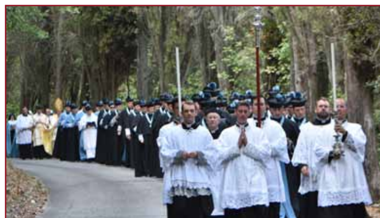
Procession jusqu'à la Maison des sœurs Adoratrices