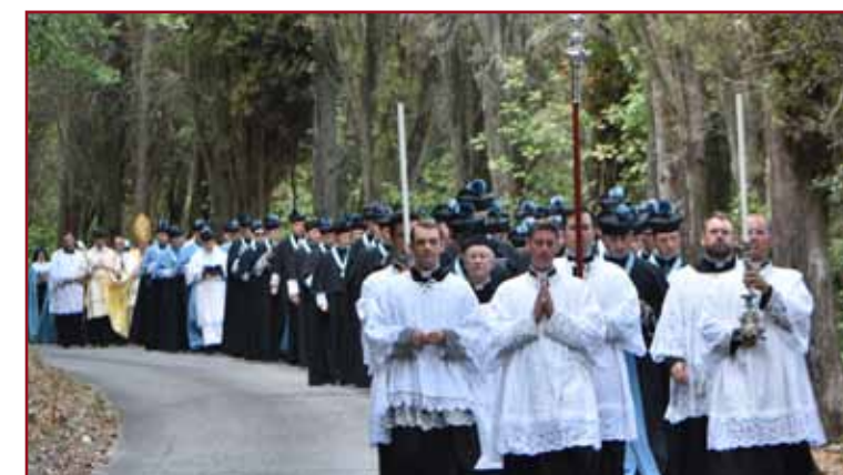
Procession jusqu'à la Maison des sœurs Adoratrices