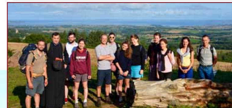
Première édition de la Marche des sept saints en Bretagne