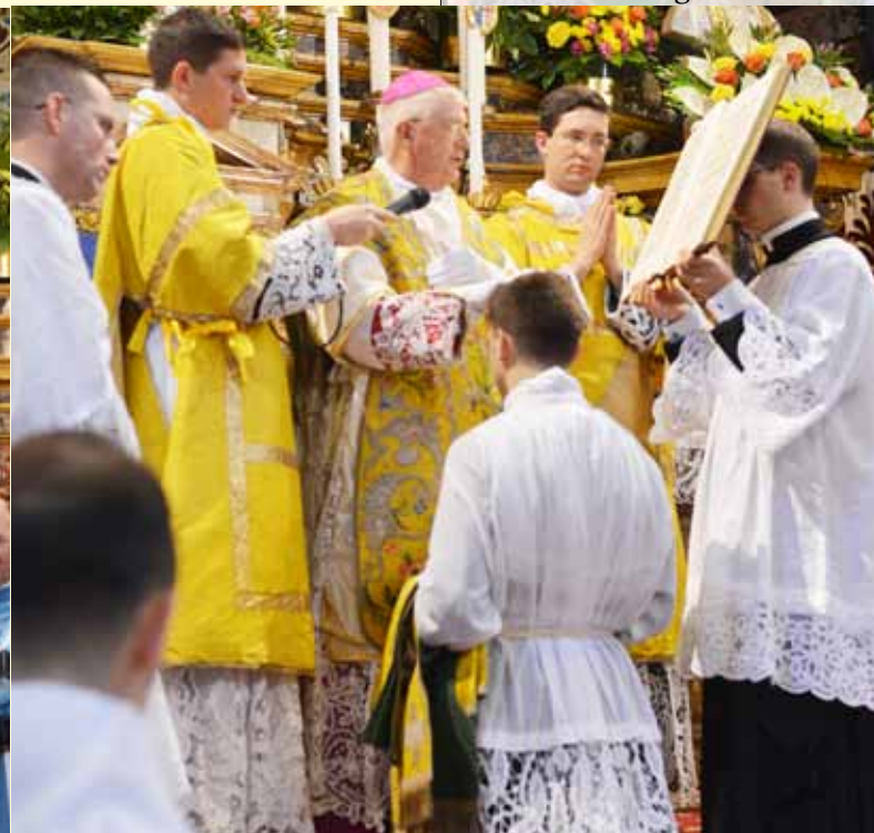
Ordination des diacres