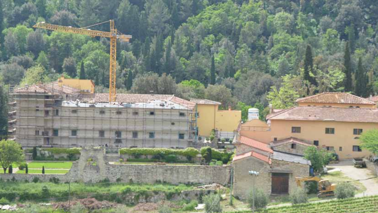
Gricigliano en mai 2015 : la plus grande partie des toits de la Villa est restaurée.