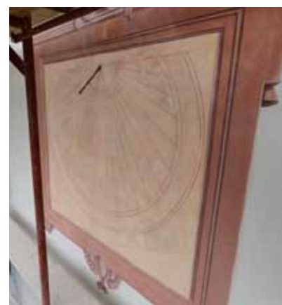
Le cadran solaire en mai 2014 et en mai 2015... L'artiste qui l'a restauré a déjà effectué d'importants travaux dans la maison de nos sœurs.