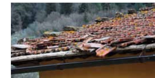
Tuiles du bâtiment Sainte-Marie en mars 2015

Si la réfection du toit et des façades de la Villa est quasiment achevée, il nous reste encore à restaurer les grands bâtiments annexes (Sainte-Marie, Saint-Joseph). Lors d'une récente tempête, les tuiles s'envolaient tombant sur le parking à côté des voitures... et laissant des trous béants sur le toit.