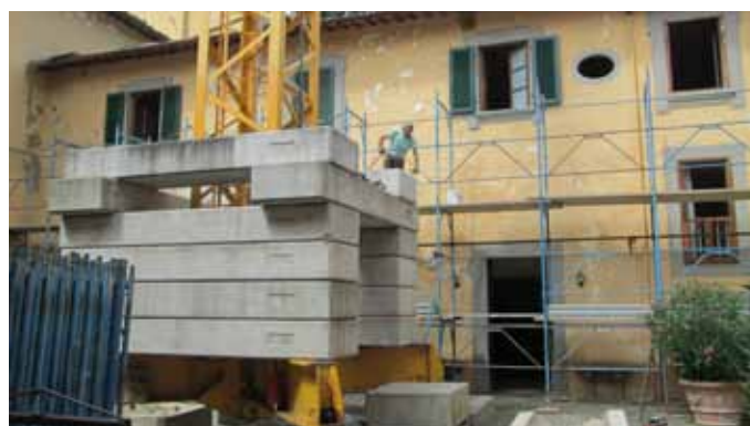
La cour intérieure lors du montage des échafaudages et après restauration. On aperçoit les blocs en béton qui maintiennent le pied de la grue : le poids de chacun d'entre eux varie entre 800 et 2500 kg pour les plus longs.