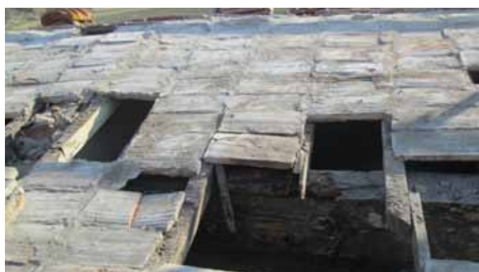
État des toits lorsque les tuiles ont été retirées. On aperçoit la poutre principale, fortement attaquée par les infiltrations. Photo de droite, le toit refait avec une partie des tuiles anciennes ; on aperçoit à gauche l'étanchéité posée sous les tuiles.