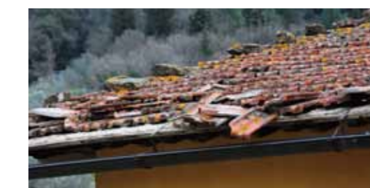
Tuiles du bâtiment Sainte-Marie en mars 2015

Si la réfection du toit et des façades de la Villa est quasiment achevée, il nous reste encore à restaurer les grands bâtiments annexes (Sainte-Marie, Saint-Joseph). Lors d'une récente tempête, les tuiles s'envolaient tombant sur le parking à côté des voitures... et laissant des trous béants sur le toit.