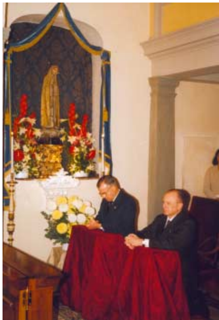
L. L. A. I. R. Dom Bertrand et Dom Luis d'Orléans et Bragance, du Brésil.