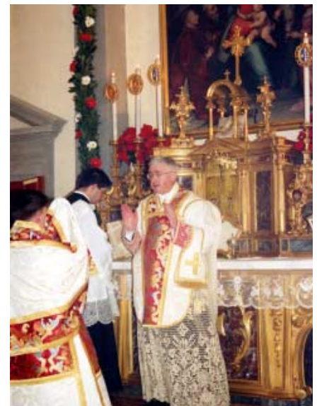
Messe de Minuit : «Orate, fratres».