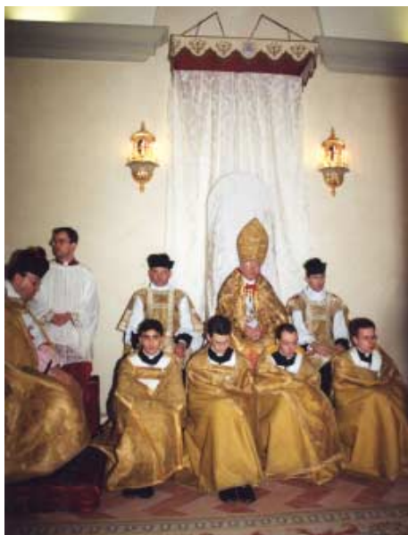
Les porte-insignes de l'évêque en chape, assis au pied du pontife.

E t notre prieur général conclut son sermon par cette prière : « O notre saint patron bien-aimé, aujourd'hui particulièrement nous sentons votre présence parmi nous ; c'est pourquoi nous vous invoquons, c'est pourquoi nous vous supplions, c'est pourquoi nous vous prions d'intercéder auprès de la Trinité Sainte en notre faveur afin que nous devenions ce que vous avez été sur terre : un prophète du Dieu très haut, très grand et infiniment bon. »