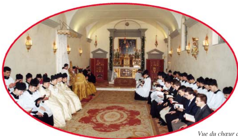
Vue du chœur de la chapelle pendant les Vêpres.

A près les Vêpres, une réception permit aux nombreux amis de Gricigliano venus pour la circonstance, de rencontrer Mgr Antonelli, et chacun put s'entretenir avec Son Excellence dont le sourire chaleureux réchauffait les cœurs et témoignait de sa bienveillance toute paternelle.