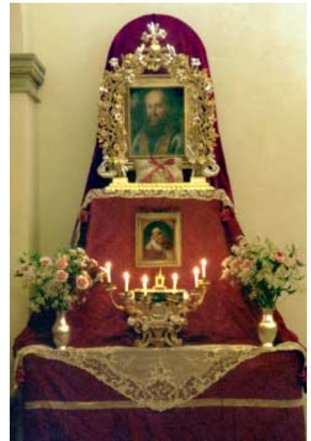
8 décembre 2002, en l'honneur du 4 ème Centenaire de la Consécration épiscopale de saint François de Sales.