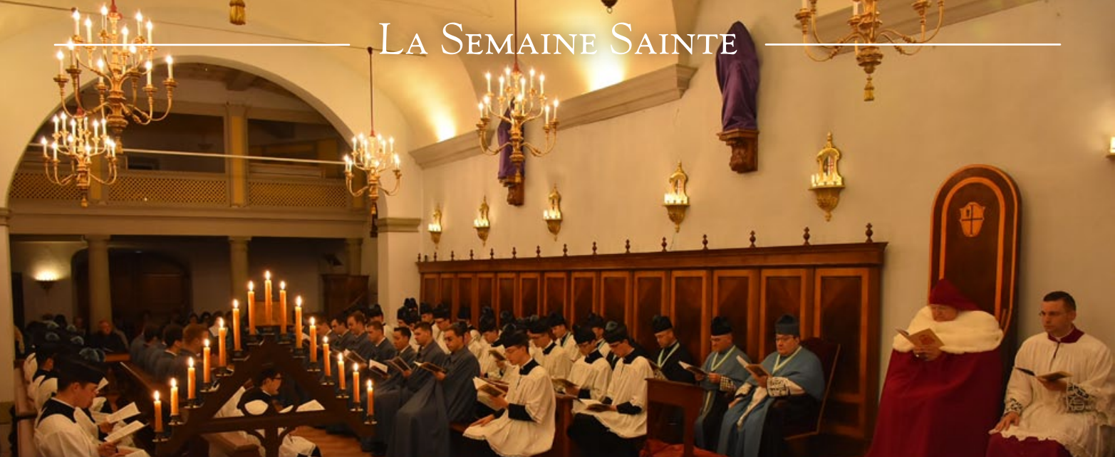
Messe des Présanctifiés célébrée par S.E.R. le Cardinal Burke