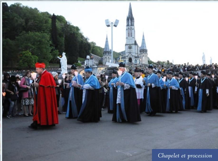
Chapelet et procession