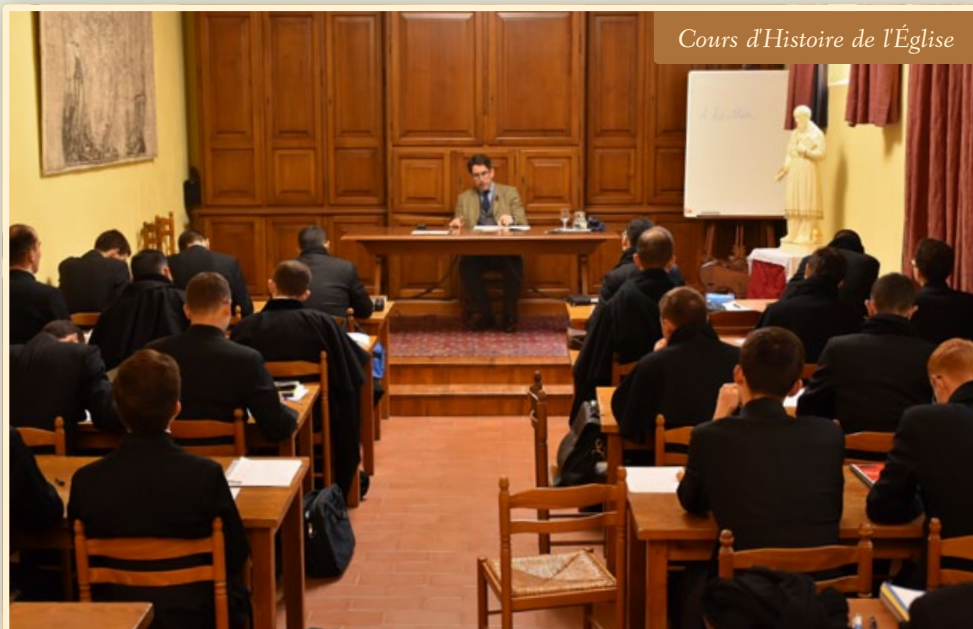
Cours d'Histoire de l'Église

A PRÈS LA PRIÈRE, la vie du séminariste est centrée sur les études ecclésiastiques. Aux sessions de cours habituelles (Philosophie, Théologie, Spiritualité, Histoire de l'Église, Latin, Liturgie, ...), qui forment l'essentiel de la formation intellectuelle, s'ajoutent des conférences plus ponctuelles sur divers sujets tant historiques qu'actuels.