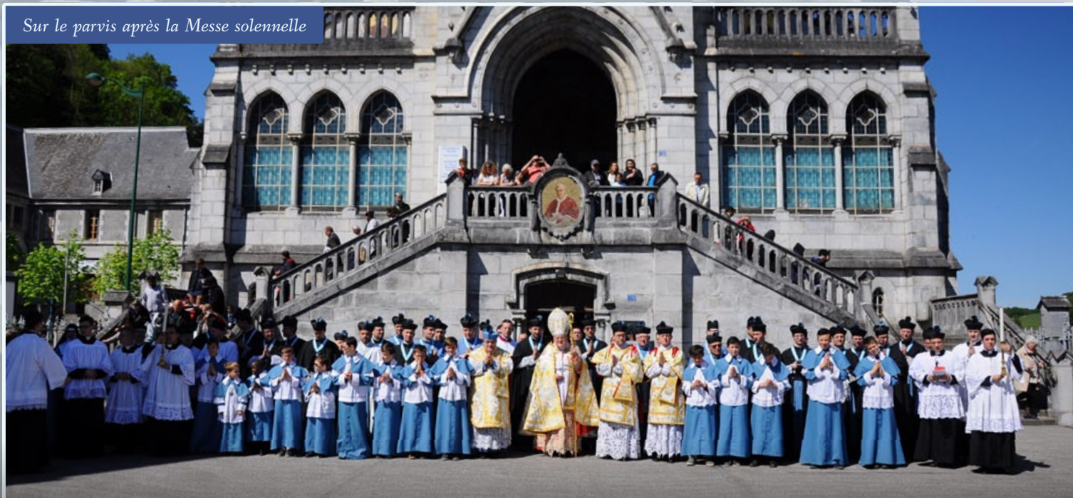
Sur le parvis après la Messe solennelle

Ô Marie, conçue sans péché, priez pour nous qui avons recours à vous !