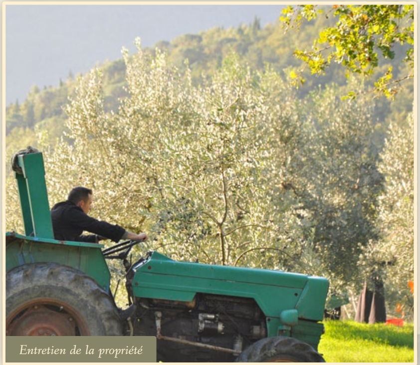
Entretien de la propriété