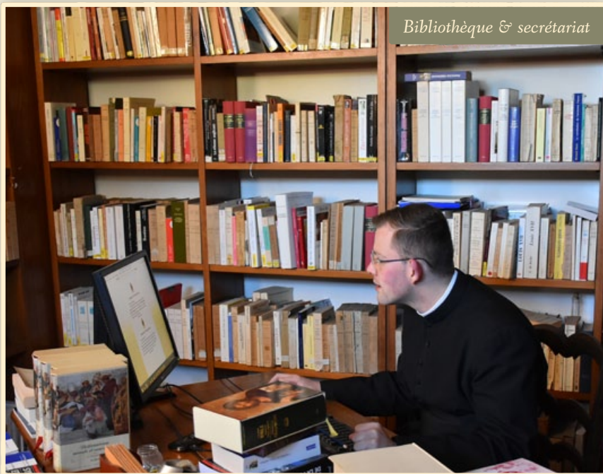
Bibliothèque & secrétariat

N OTRE BIBLIOTHÈQUE a dernièrement pu combler une lacune : si le rayon Pères de l'Église était déjà bien rempli par les exemplaires des Sources Chrétiennes , il lui manquait encore la fameuse Patrologie grecque et latine , compilation des textes patristiques réalisée par le célèbre abbé Migne. Les séminaristes auront ainsi un accès plus direct à la doctrine des Pères de l'Église pour profiter de leur belle sagesse.