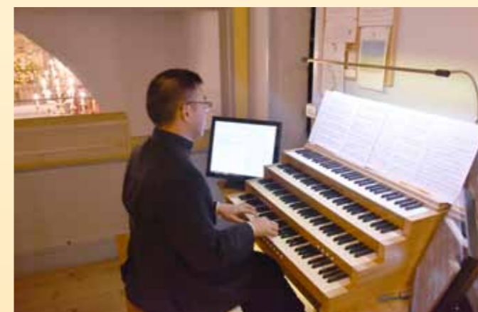
Répétition de l'organiste