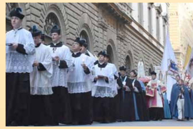
Procession à Florence en l'honneur de Marie Reine