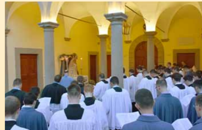
Mois de Marie