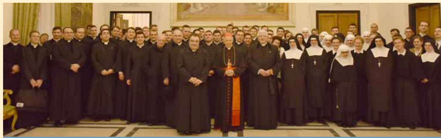
Photo souvenir avec S. E. R. le Cardinal Angelo Bagnasco, archevêque de Gênes.