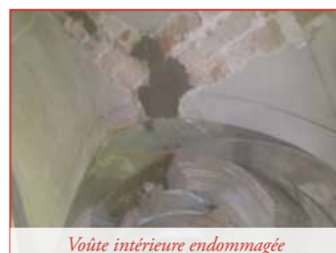
Voûte intérieure endommagée