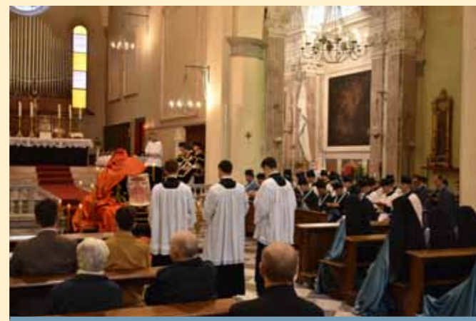
Messe solennelle de Requiem