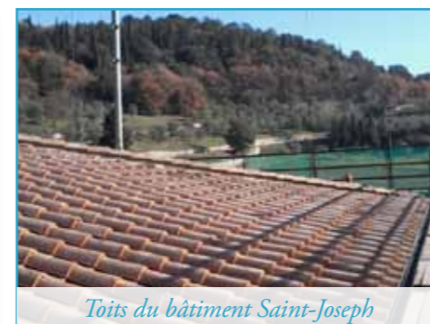
Toits du bâtiment Saint-Joseph