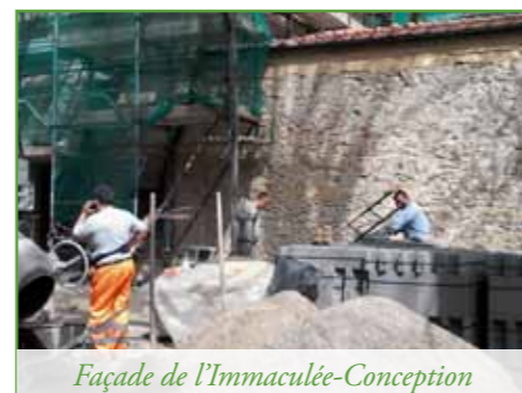
Façade de l'Immaculée-Conception

À ce jour, 220 000 € nous manquent pour payer ces travaux de Saint-Joseph et de la chapelle de la Sainte-Trinité : nous comptons sur votre aide pour nous aider à les achever ! Merci de votre générosité !