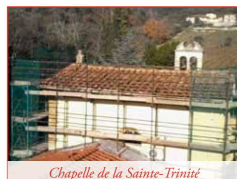
Chapelle de la Sainte-Trinité