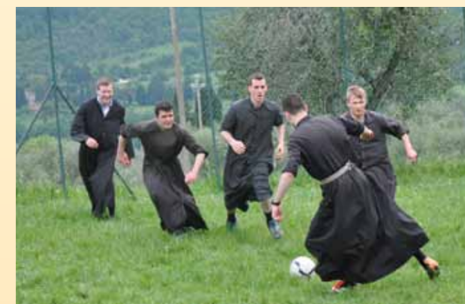
Partie de football