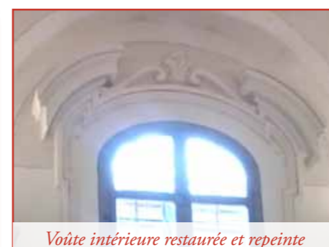
Voûte intérieure restaurée et repeinte

Retrouvez la vie de l'Institut et les nouvelles du Séminaire, avec d'autres photos et de nombreux documents sur internet :