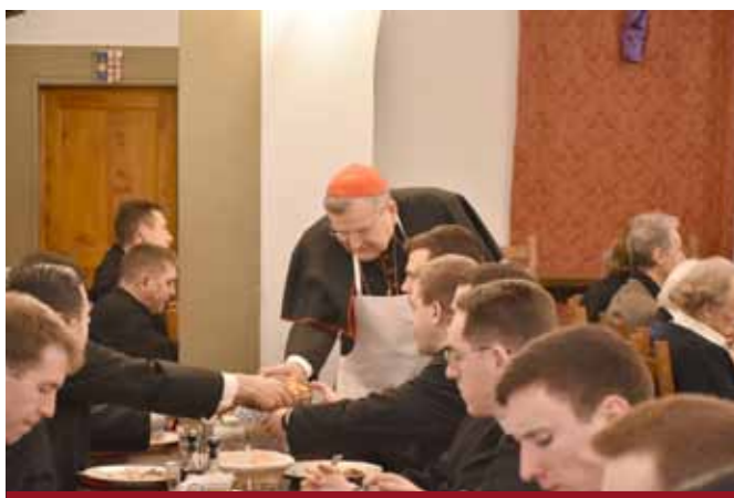
Vendredi Saint : Son Éminence sert les séminaristes.

Les séminaristes n'ont pas ménagé leur peine pour la préparation de ces saints jours et furent heureux de partir en vacances dès le lundi de Pâques, tout rayonnants de la joie de la Résurrection !