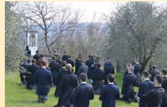
Chapelet récité en communauté