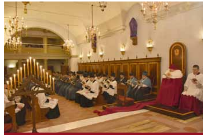
Chant de l'Office des Ténèbres dans la chapelle du Séminaire

Pour la deuxième année consécutive, S. E. R. le Cardinal Burke nous a fait l'honneur de célébrer le Triduum pascal et la fête de Pâques au Séminaire de Gricigliano et dans notre église Saints-Michel-et-Gaétan à Florence. Tous furent une nouvelle fois édifiés par son humilité et la grave dignité avec laquelle il remplit les fonctions pontificales dans les cérémonies liturgiques.