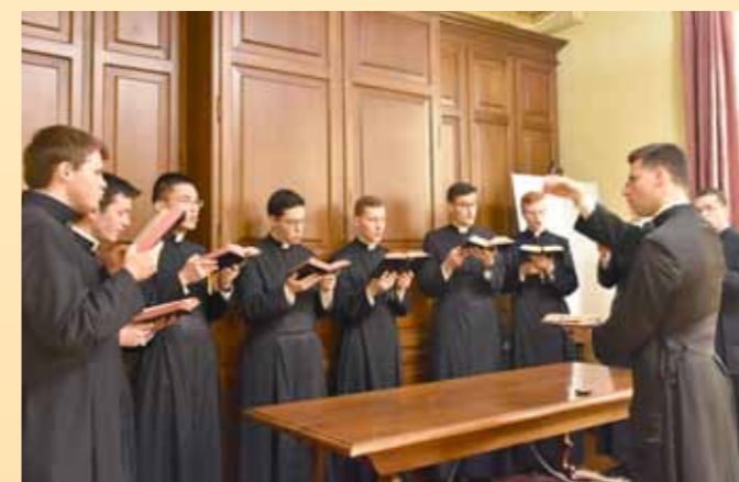
Répétition de la schola