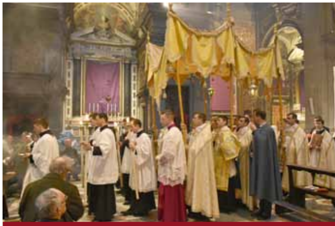
Jeudi Saint : Procession du Saint Sacrement au Reposoir.