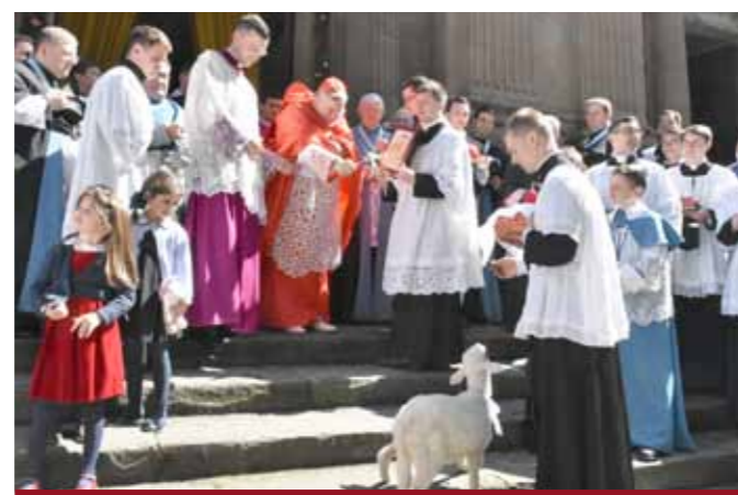
Dimanche de la Résurrection : bénédiction de l'agneau pascal.