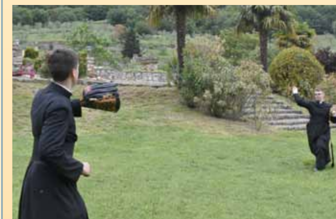
Lancers de baseball