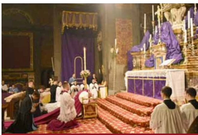
Vigile pascale : chant des Litanies des Saints.