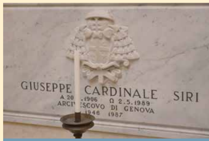
Tombe du Cardinal Giuseppe Siri à la cathédrale

Enfin, S. E. R. le Cardinal Angelo Bagnasco, actuel archevêque de Gênes nous accorda une longue audience à l'archevêché, à l'issue de laquelle nous reçûmes sa bénédiction. Il nous fit la faveur de nous adresser un entretien spirituel dans lequel il souligna l'importance de la Sainte Eucharistie, de la dévotion mariale et de la prédication d'une doctrine claire et précise comme moyens sûrs d'un renouveau spirituel en nos temps difficiles.