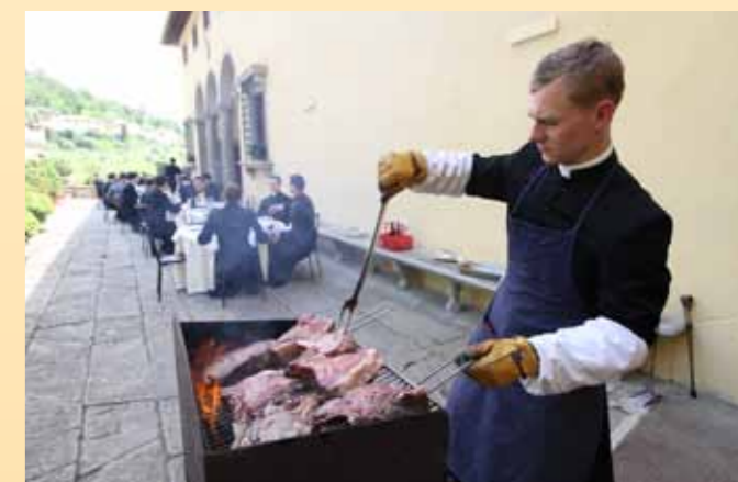
Grillade un jour de fête