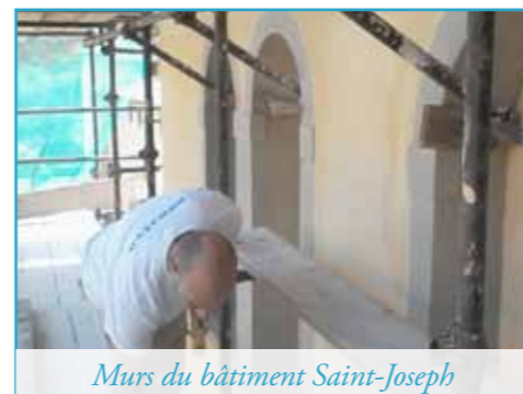
Murs du bâtiment Saint-Joseph