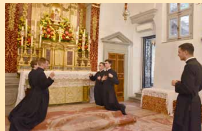
Répétition de fonctions liturgiques