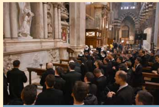
Prière devant la tombe du Cardinal