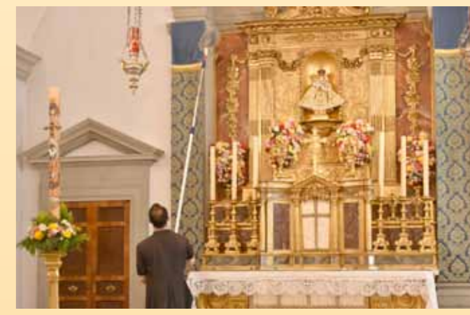
Nettoyage de la chapelle