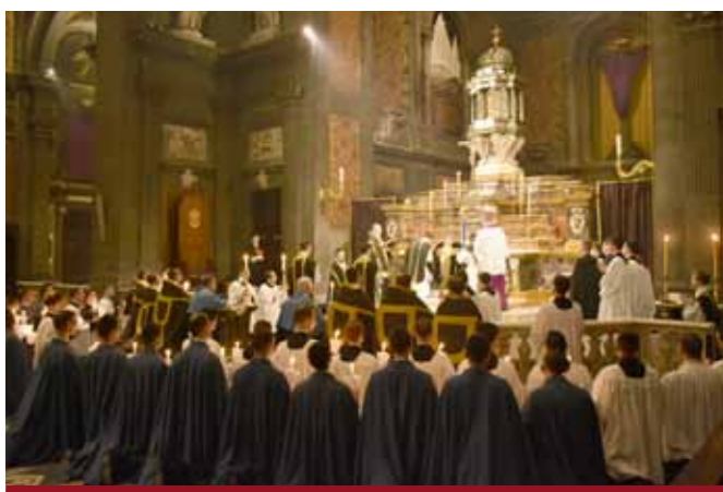
Messe des Présancifiés