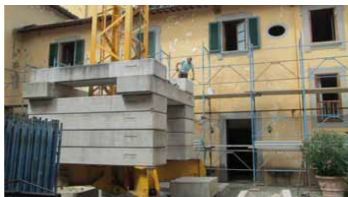
La cour intérieure lors du montage des échafaudages et après restauration. On aperçoit les blocs en béton qui maintiennent le pied de la grue : le poids de chacun d'entre eux varie entre 800 et 2500 kg pour les plus longs.