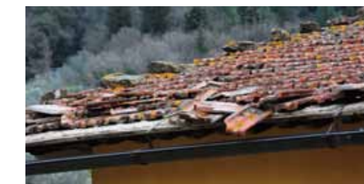
Tuiles du bâtiment Sainte-Marie en mars 2015

Si la réfection du toit et des façades de la Villa est quasiment achevée, il nous reste encore à restaurer les grands bâtiments annexes (Sainte-Marie, Saint-Joseph). Lors d'une récente tempête, les tuiles s'envolaient tombant sur le parking à côté des voitures... et laissant des trous béants sur le toit.