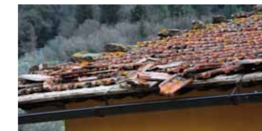
Tuiles du bâtiment Sainte-Marie en mars 2015

Si la réfection du toit et des façades de la Villa est quasiment achevée, il nous reste encore à restaurer les grands bâtiments annexes (Sainte-Marie, Saint-Joseph). Lors d'une récente tempête, les tuiles s'envolaient tombant sur le parking à côté des voitures... et laissant des trous béants sur le toit.