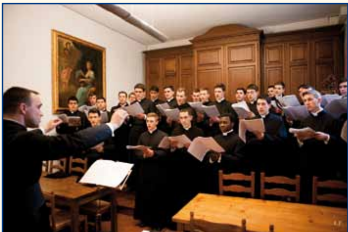
Répétition de communauté.