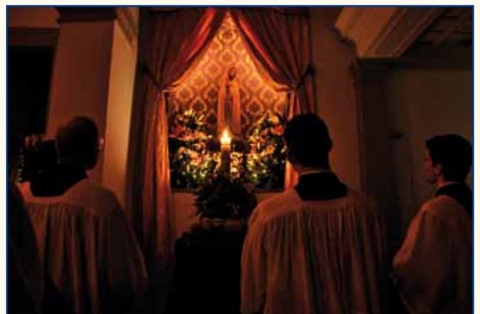
Prière à l'Immaculée-Conception après les Complies.

Depuis les Complies jusqu'à l'Office des Laudes du lendemain, nous gardons avec rigueur le « Grand Silence » qui favorise ce tête à tête intime entre l'âme et son Créateur et sanctifie jusqu'à notre repos.