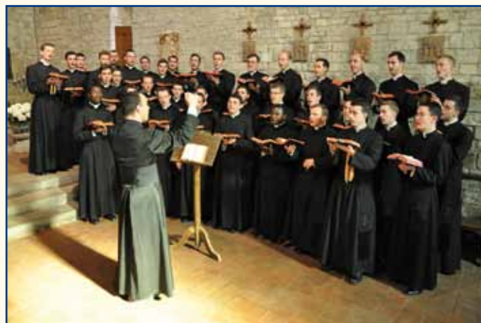
Répétition pour un enregistrement.

Tous les détails des CD sont sur notre site www.icrsp.org