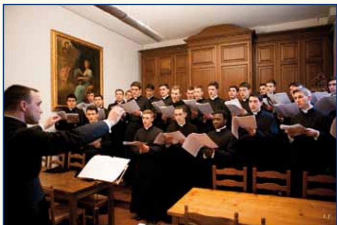
Répétition de communauté.