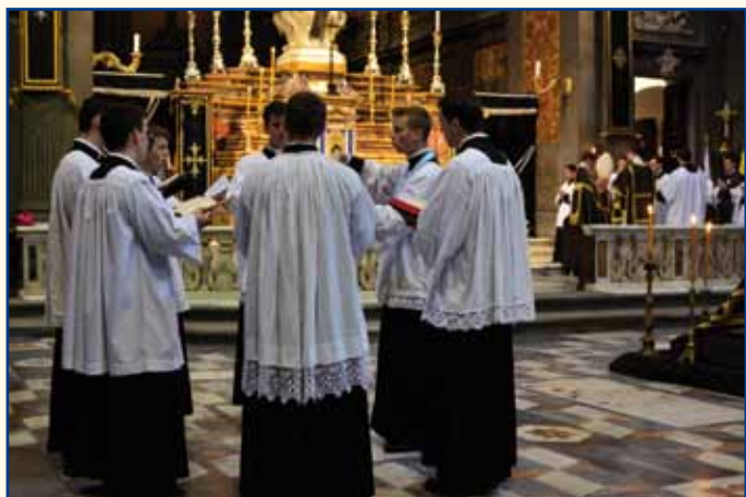
Messe pontificale de Requiem chantée par la schola.

cinq CD que nous avons pu enregistrer, chacun d'eux demandant une grande préparation. L'unité de la communauté s'y fait entendre de même que l'exigence de notre maître de chœur. Avec la grâce de Dieu et vos prières, nous continuerons.