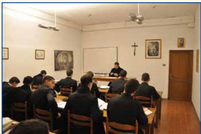
Cours de philosophie.

de théologie, principalement ceux de saint Thomas d'Aquin, maître pour les études ecclésiastiques, comme l'ont rappelé le deuxième Concile du Vatican ainsi que de nombreux papes, Léon XIII, Pie XI, le Bienheureux pape Jean-Paul II, Benoît XVI, et comme l'exige le Code de Droit canonique. Sans oublier l'Histoire de l'Église, la Patrologie, le chant grégorien... Avec un tel programme, les trois semaines d'examen sont bien remplies !