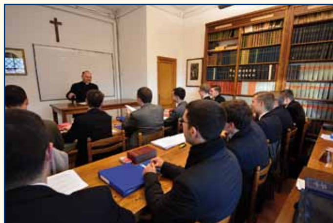
Cours de doctrine pour les séminaristes de la première année.