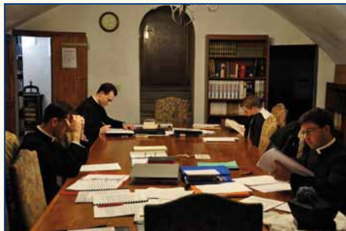
Révisions dans la salle de lecture de la bibliothèque.