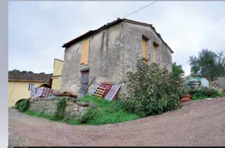
Speriamo di fare qualche camera supplementare nella costruzione adiacente.

L i riassetto interno continua lentamente, nell'attesa di cominciare i lavori dell'edificio attiguo.