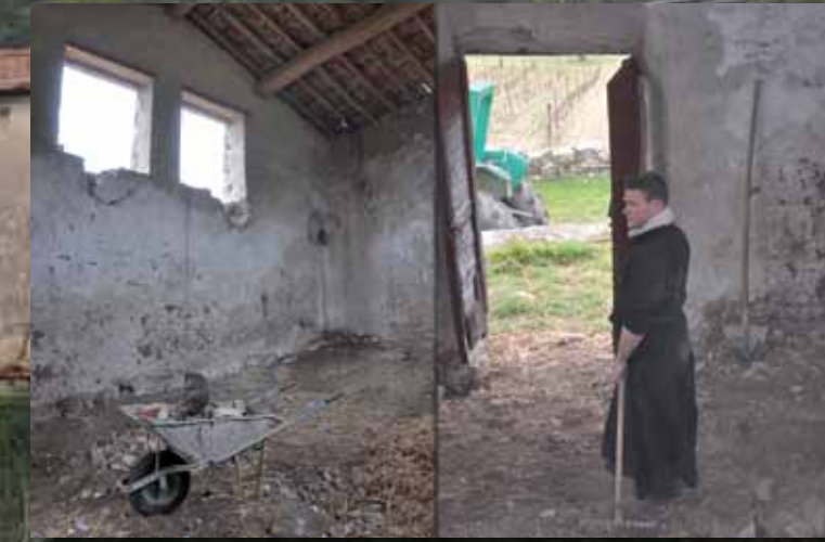
I seminaristi dopo una piccola inondazione...