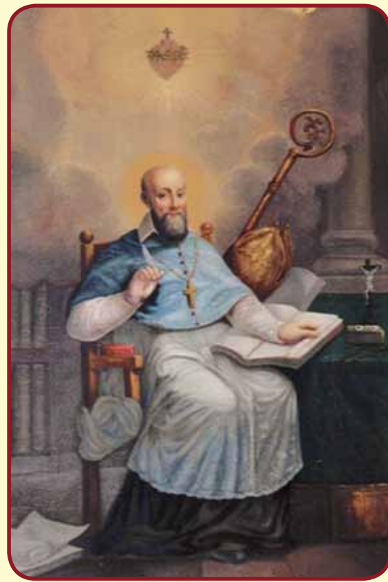
S. Francesco di Sales, Cattedrale di Le Puy

Sermone di San Francesco di Sales per il Mercoledì delle Ceneri (9 febbraio 1622).