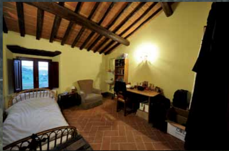
Due nuove camere ben sistemate.