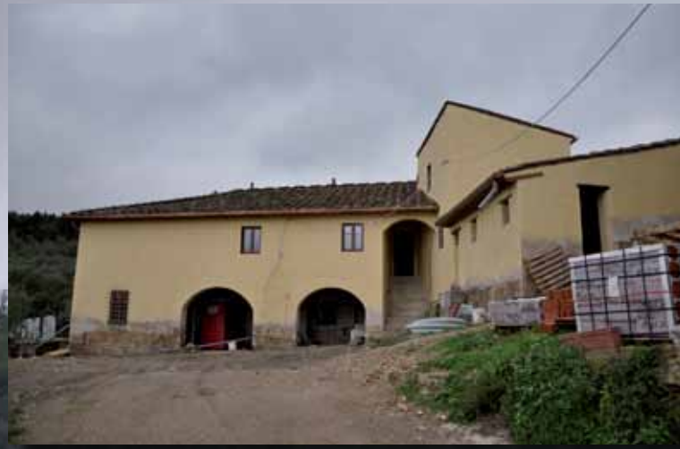
La nuova facciata è stata imbiancata nel colore tradizionale in Toscana.